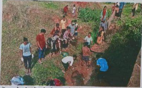
डोड़काचौरा रोड में नदी की सफाई में उतरे कॉलेज के स्टूडेंट्स।

बांकी नदी को बचाने जशपुरनगर से शुरू हुई मुहिम में अब गांव भी जुड़ चुके हैं। बोते 24 मई को बांकी नदी के क्षेत्र में पड़ने वाले दस गांव में विशेष ग्राम सभा का आयोजन हुआ था। ग्राम सभा में ग्रामीणों को नदी के अस्तित्व बचाने के लिए जागरूक किया गया। नतीजा अब रोजाना ग्रामीण खुद ब खुद नदी के किनारे जुट रहे हैं और नदी की सफाई में श्रमदान कर रहे हैं। अधिकांश महिलाओं ने तो नदी की सफाई के लिए मजदूरी का काम भी फिलहाल बंद कर दिया है। महिलाएं मजदूरी करने शहर ना जाकर नदी में ही पसीना बहा रही हैं। बांकी नदी का उदम स्थल ग्राम सितोंगा में है। यह नदी भुड़केला के