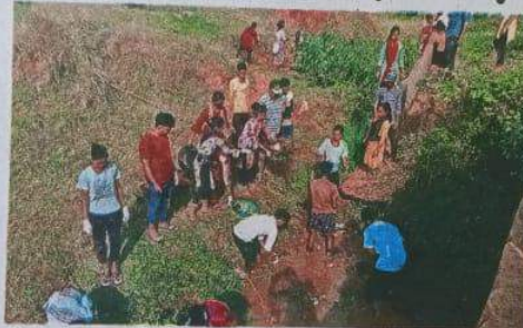
डोंडकाचौरा रोड में नदी की सफाई में उतरे कॉलेज के स्टूडेंट्स।

बांकी नदी का उदम स्थल ग्राम सितोंगा में है। यह नदी भुइकेला के