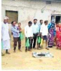
ग्रामीण क्षेत्रों में छात्र जैविक खेती के लिए कर रहे जागरूक।

जिसमें पंचायत के कई मजदूर टोले के ग्रामीण किसान उपस्थित रहे, छात्र के स्वयं के द्वारा बनाया गया वर्मी कम्पोस्ट को दिखाते हुए किसानों को बताया कि वर्मी कम्पोस्ट को रामायनिक खाद के उपयोग से होने वाली हानि तथा दुष्प्रभावों की भी जानकारी देते हुए रामायनिक खाद